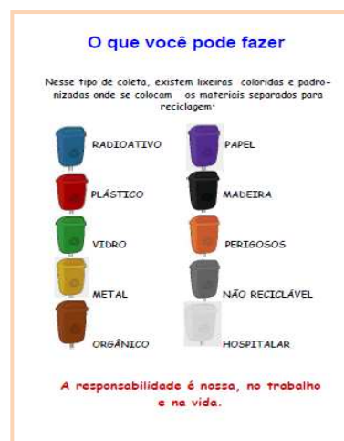
Figura 3. Página 11 da cartilha