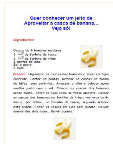
Figura 6. Página 28