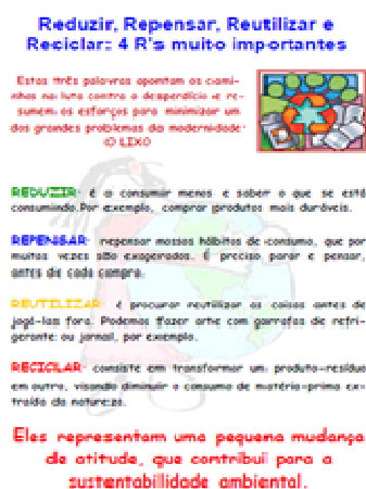
Figura 1. Página 8 da cartilha

Acreditando que de fato a Educação Ambiental é interdisciplinar e envolve a responsabilidade de todos, através da Cartilha de Educação Ambiental vê-se uma oportunidade para ser trabalhada esta interdisciplinaridade dentro da escola. Trabalhando com a Cartilha Educação Ambiental, além de proporcionar uma excelente oportunidade para os alunos aprenderem de uma forma diferente e divertida, instiga também a pesquisa sobre os impactos humanos na natureza, sobre a destruição que temos causado, desenvolvendo o senso crítico e fazendo com que busquem atitudes que possam minimizar ou mesmo resolver os problemas em questão.