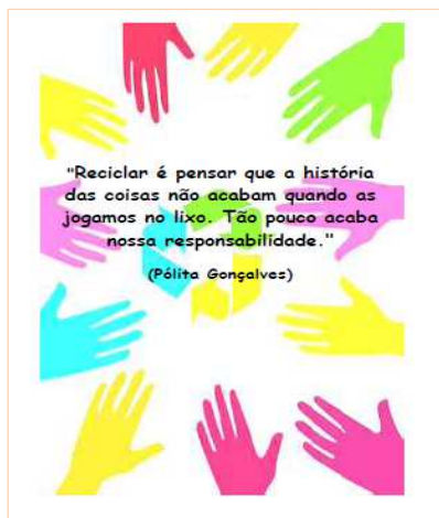
Figura 4. Página 12 da cartilha