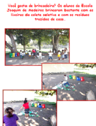
Figura 5. Página 20