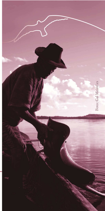
Figura 3. Imagem de uma página da Cartilha Pesca.

Inicialmente a proposta foi apenas de elaboração das Cartilhas, porém ao final, com os oito volumes impressos e em uso, por sugestão de pesquisadores do Projeto BTS, foi elaborado um encarte com uma brochura sobre o Projeto. A brochura sobre o projeto BTS foi elaborada pelo núcleo gestor, também de forma colaborativa.