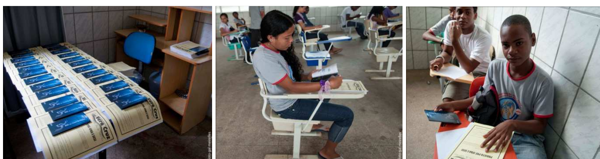
Figura 3. Coleção cartilhas: uso na prova de seleção de alunos para o curso pré-IFBA.

A Coleção Cartilhas foi utilizada também pela organização não governamental Pró-Mar que atua junto a comunidades pesqueiras realizando ações de educação ambiental, e como fonte para a redação na prova de seleção de alunos para o curso pré-IFBA oferecido pela Secretaria Municipal de Educação de Vera Cruz (Figura 4).